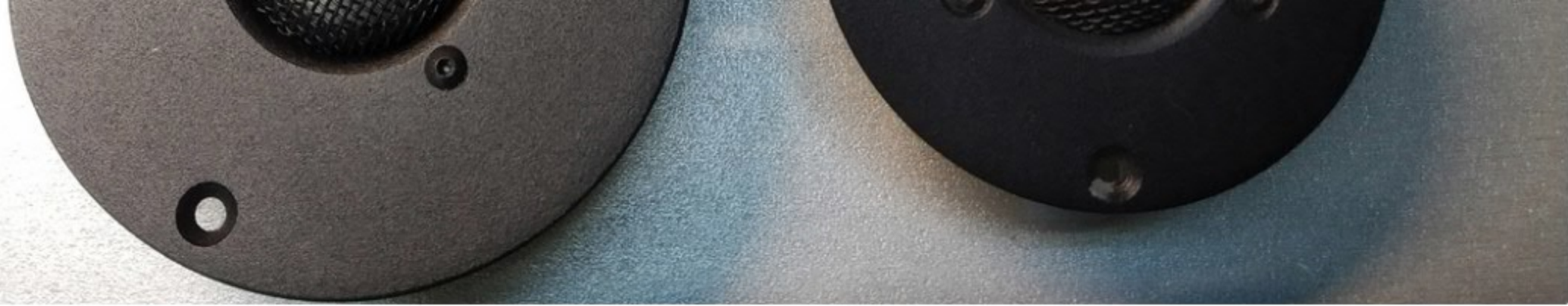
слева T290.1.8 справа T292.1.8