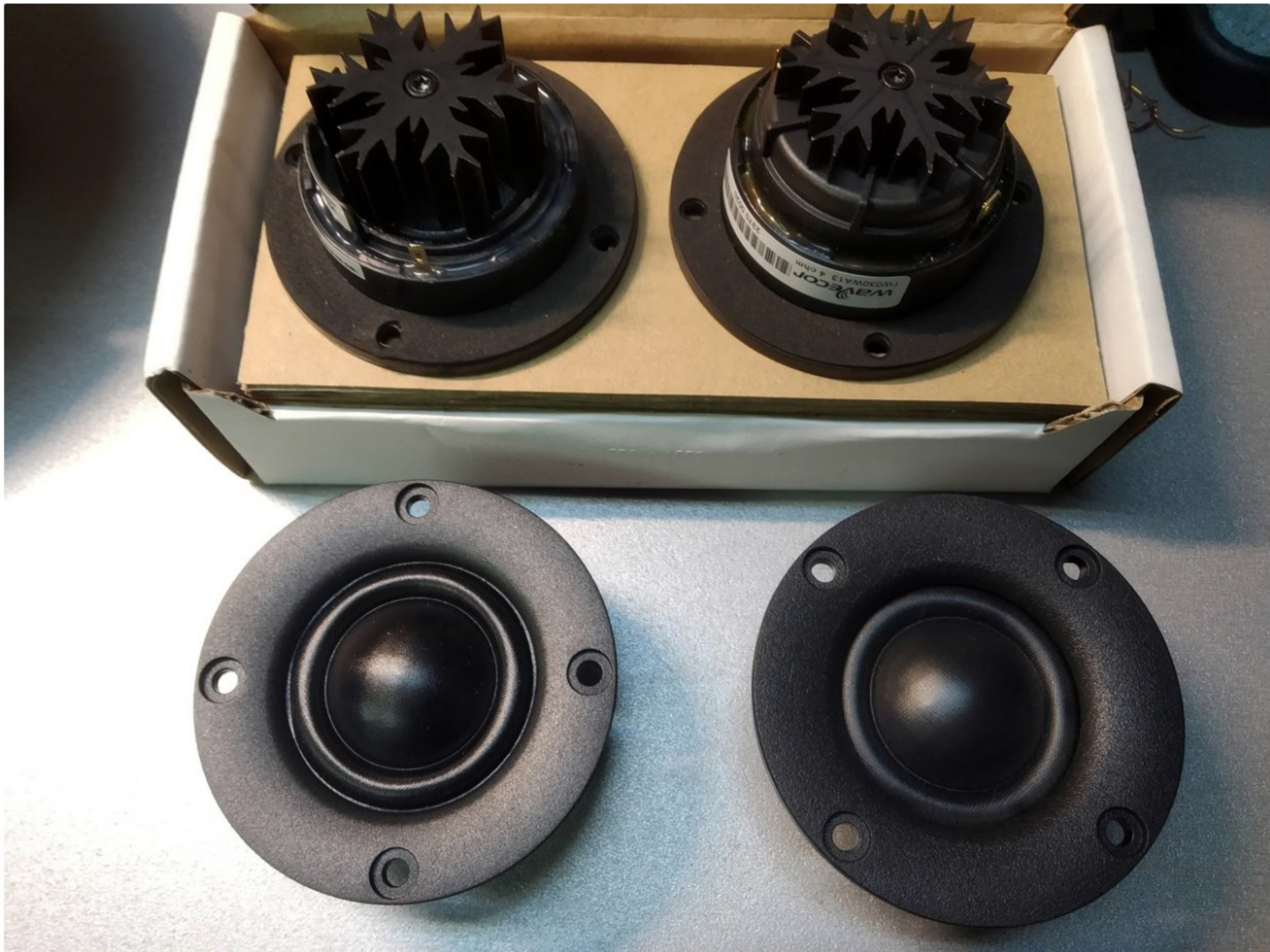
слева TW30WA01 справа TW30WA13