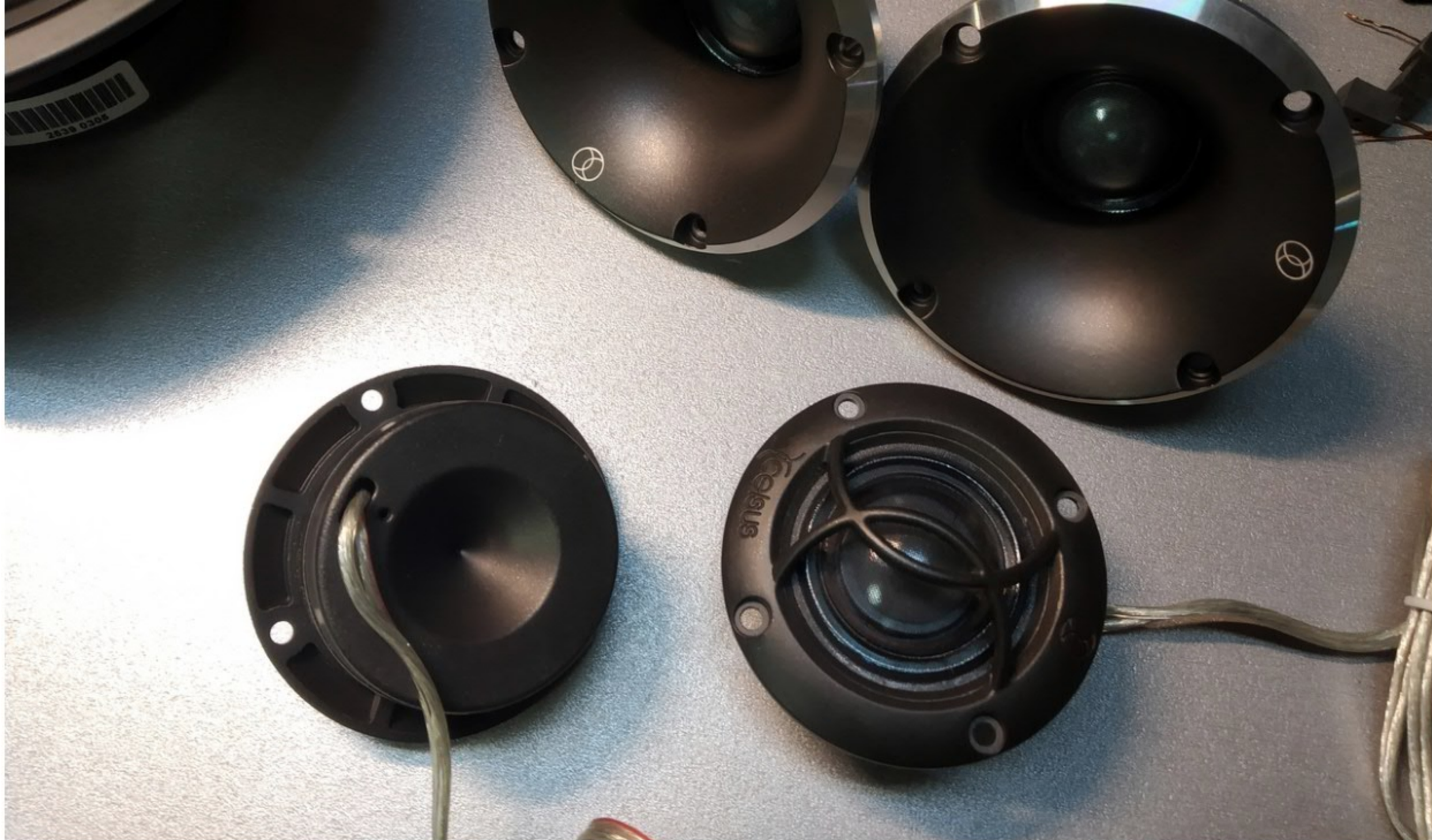
сверху XXT30W снизу XXT30 true SQ)))